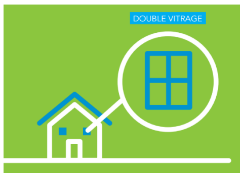
Protection par l'isolation de façade

Cette solution est proposée dans le cas de bâties isolés au-dessus des seuils réglementaires. L'isolation acoustique est faite à même la façade de l'habitation , via, par exemple, la mise en place d'un double vitrage, l'isolation des murs et/ou de la toiture.