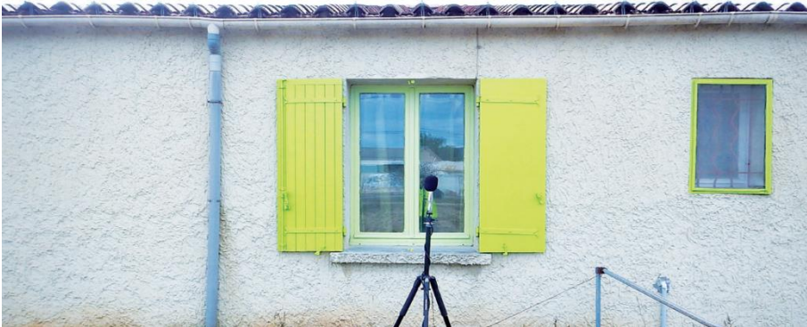
Prise de mesures acoustiques sur site

Ainsi, tout est mis en œuvre avant la mise en service pour prévoir les nuisances acoustiques engendrées par une ligne à grande vitesse et prévenir les impacts possibles sur les populations . En complément du calcul de la contribution sonore, SNCF Réseau établit un état initial précis en se rendant sur le terrain. À ce jour, près d'une cinquantaine de mesures ont été réalisées , dont près de trente sur la phase 1.