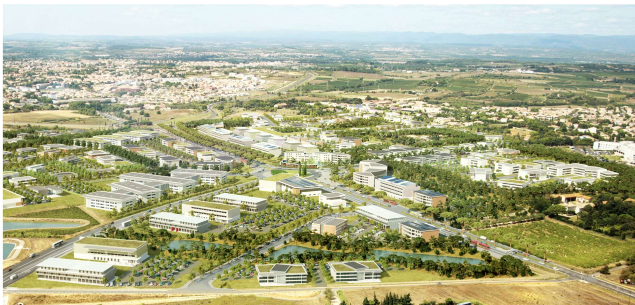
L'écosystème EDEN - projet site de Mazeran - Béziers

10 à 12 000 emplois directs et indirects créés d'ici 2040/2050